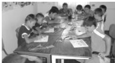
Egész hét folyamán tartanak a napközi foglalkozások

családcentrikusak, aki emberszámba veszi őket, aki szót tud érteni a gyerekekkel, azt ők is el fogják fogadni. A cigányok azokkal működnek együtt, akiket tudnak tisztelni. Meg kell látnunk bennük mindazt, ami pozitív, hiszen például ezek a gyerekek gyönyörűen táncolnak, énekelnek, miközben a felnőttek, szüleik zenével kísérik őket. Természetesen a negatív dolgokat is óhatatlanul látjuk, de éppen azért van a cigánymisszió, hogy azt keresse, ami érték, ami összeköt és ne azt, ami elválaszt.