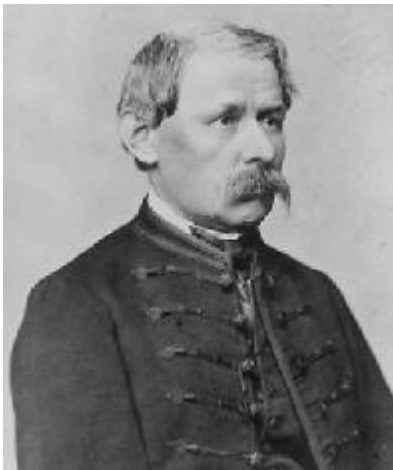
„Él még a jó Isten! Ő engem is szeret”

A Schola Reformata Szalontaiensis-ben töltött tíz év alatt megtanult mindent, amit lehetett, de tudásszomját az iskola nem elégítette ki. Elolvasott minden könyvet, amelyhez hozzájuthatott, különösen a költői műveket. „A Bibliának nem maradt része olvasatlan, kétszer, háromszor is” – vallja maga a költő. Olvasmányai nemcsak tudását gyarapították, de korán kibontakozó költői tehetségét is fejlesztették. A költészet osztályba jutva halomra írta verseit, latinul és magyarul, melyekkel hírnevet szerzett magának („mint afféle poéta”) a szalontai kis világban s környékén. Sajnos, e kezdeti próbálkozások elvesztek.