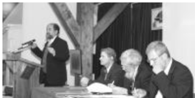
A konferencia első napjának előadói. Balról jobbra: Bóna Zoltán , Nicodim Bulzesc , Dieter Brandes és Tőkés László

Tőkés László püspök, EP-képviselő reményét fejezte ki, hogy a romániai egyházak még az idén aláírják a Chartát, mely nagyban hozzájárulna az ökumenikus kapcsolatok erősödéséhez. A keresztyén Európáról érkező előadó rámutatott: csak akkor érheti el célját az Európai Unió, ha keresztyén motivációja van, ha komolyan veszi a keresztyén értékeket. A keresztyén ember egészen másként viszonyul gazdasági, környezetvédelmi és egyéb témákhoz, mint egy szakbarbár vagy egy európai bürokrata – hangsúlyozta a püspök, hozzátéve: „számunkra a keresztyénség az identitásunk lelke, szíve, középpontja”.