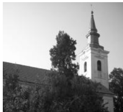
Pirosban virít a gyaraki templomtető a cserepezési munkálatok befejezése után

A hívek is behozták adományaikat a lelkészi hivatalba, mondván: „Elődeink mindig tudták, hogy a templom javítása mindenki fe-