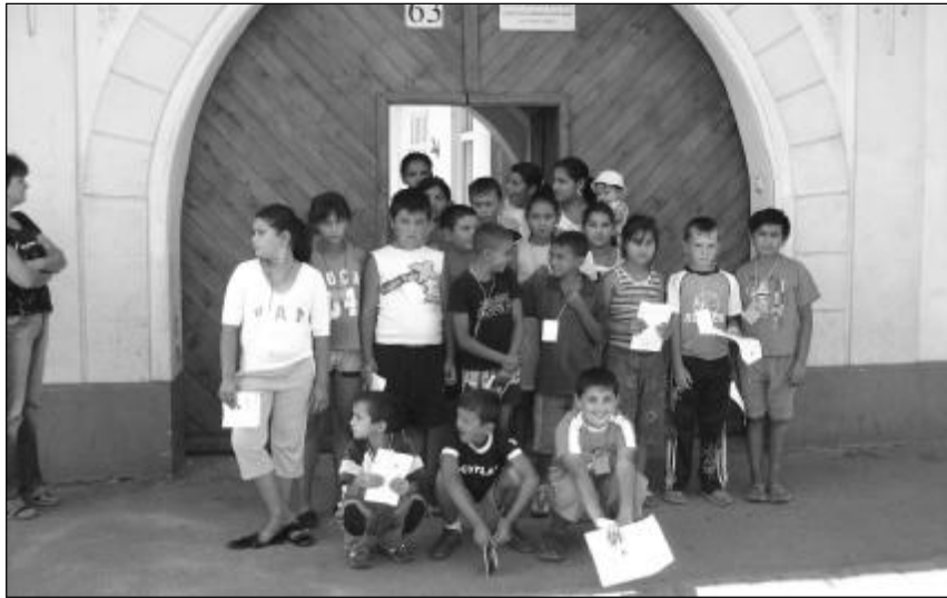
Gyerekek a Cigánymissziós Központ Kolozsvári úti székháza előtt. A napközis foglalkozás keretében ebédet kapnak, játszanak, bibliai énekeket, történeteket tanulnak

A hit, az egyház és a magyar nyelv olyan integráló erő, melynek megkerülhetetlen szerepe van a cigányság társadalmi beilleszkedésében – vallja Nagy József Barna, a Királyhágómelléki Református Egyházkerület nagyváradai Cigánymissziós Központjának vezetője. A cigánymisszió egyik hangsúlyos célja, kárpátaljai egyházi példa nyomán, református cigánygyülekezetek alapítása.