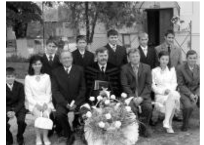
A biharszentjánosi gyülekezetben tíz ifjú tett esküt magyar református anyaszentegyháza mellett