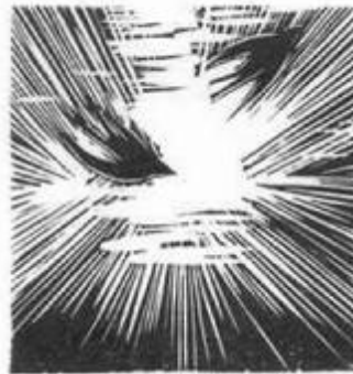
Gy. Szabó Béla alkotása