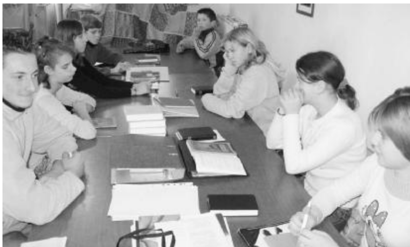
„A kátéórán minden gondom elszállt.” A nyüvedi fiatalok a felkészülés során