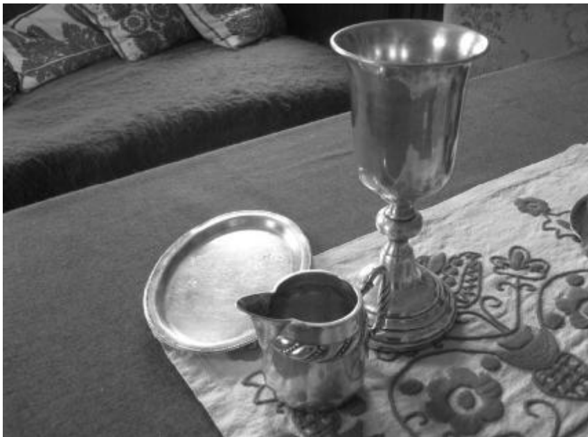
Úrvacsorai kehely, keresztelő kancsó és tányér. A nemrég előkerült krassófüzesi kegyszerek a resicabányai gyülekezet használatába kerültek