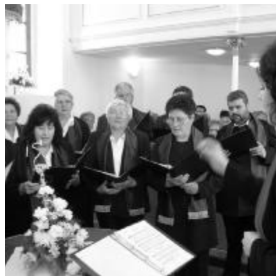
A Bátorkeszi Református Énekhar tavaly októberben Nagyváradon is fellépett

KÓRUSTALÁLKOZÓT TARTOTTAK A ZILAHAI EGYHÁZMEGYÉBEN. Az április 20-i Cantate vasárnapon ezúttal a Szilágysámszon-i gyülekezet látta vendégül az évenként megrendezett találkozót. Bogdán Zsolt esperes igehirdetésében kiemelte: értékváltságban szenvedő világunkban szavainkkal, cselekedeteinkkel, éneklésünkkel