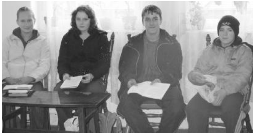
„Hamar eltelt ez a két év”... A misztótfalui konfirmandusok