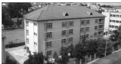
A Zilahi Református Wesselényi Kollégium jelenlegi épülete.