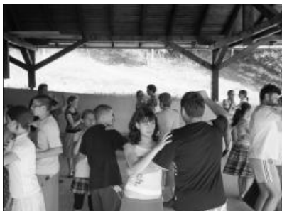
Hagyományápolás a magyar táncnyelv elsajátításáért. Közel száz fiatal vett részt az első alkalommal megszervezett solyomkővári néptánc-táborban

téklehetőségek kiapadhatatlan tárházát nyújtotta a táboron átszordogáló patakocskák. Aki nem a gátak építésével volt elfoglalva, az a karikás ostor csattintásának lehetőségeit tanulmányozta, több-kevesebb sikerrel. Ebéd után is a tánc-tanulásé volt a szerep 18 óráig. Vacsora után minden este tánc-hívogatta az ifjúságot. Lendületes szilágy-sági, szatmári, széki és mezőszégyi táncok mulattatták őket. A csapatok a hétvégére egy-egy csoporttá kerekedtek. A minden este fellobbanó tábor-tűz maga köré vonzotta a