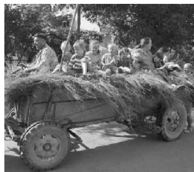
A gyermekvállalást jóval kisebb arányban befolyásolják az anyagiak, mint arra általában hivatkozni szeretünk

Szekularizálódó és globalizálódó társadalmunkban kiemelkedő feladat a nemzeti identitástudatra való nevelés. A nagy nemzetköziség szellemében mi magyarok igen hajlamosak vagyunk nemzeti öntudatunk feladására. Pedig az Európai Unió is a sokszínűsége alapoz. Iskoláink és a vallásórák megadják a lehetőséget fiataljaink nemzet-tudatának kiépítésére. Nem mások ellen, hanem értünk, nemzetünkért, vallásunkért. Reánk hagyott jussunk továbbadásáért. A gyermeknevelés nem maradhat a családok magánügye. Ne csak sajnálkozunk (avagy lenézzük) a több gyermeket vállaló szülőket, hanem egyházközösségeink vállalják fel részleges gondjait. (Például egyházi étkeztetési lehetőség biztosítása, avagy annak részleges támogatása, avagy minden 4 gyermekes családnak az egyházközösség felvállalja rezsiköltségeinek 50 százalékos megtérítését). Gyermeküdtetés, valamint a részben már megvalósult természetbeni támogatások továbbfejlesztése kiemelten a többtestvér számára. Nőszövetségeink által biz-