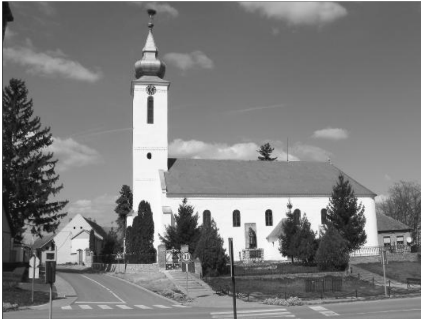
Az énekes reformátor, Sztáray Mihály temploma is megszenvedte a délszláv háború viharait. Az alig 400 főnyi laskói gyülekezet újjáépítette, de a karzatgerendákon még látszanak a pusztítás nyomai