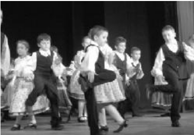
A temesvári Morzsák néptánc-együttes rászolgált a sikerre