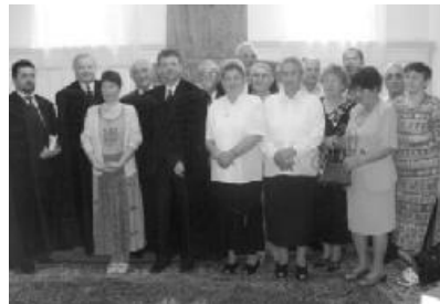
Vendégek és vendéglátók a resicabányai lelkészbeiktatáson