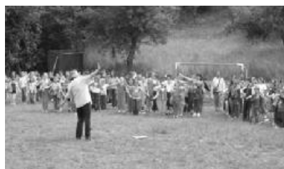
Játékos kikapcsolódásra is van lehetőségük a hidalmási ifjúsági központ látogatóinak

A HIDALMÁSI REFORMÁTUS IFJÚSÁGI KÖZPONT. Szeretettel ajánljuk figyelmükbe a Zilah Református Egyházmezgye Ifjúsági Központját Hidalmáson. A ház nyári időszakban (május 15-től szeptember 30-ig) fogad vendégeket – rendszeresen lakott, kipróbált táborhely.