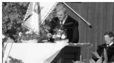
Tőkés László püspök több száz Magyarországon élő erdélyi előtt hirdette Isten Igéjét a rendezvényzáró istentiszteleten