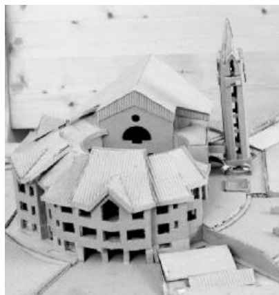
Ilyen lesz elkészülte után az épületegyüttes. A félköríves gyülekezeti ház és a templom között a kiskarzi lépcsőház biztosítja majd az összeköttetést

Ami a költségeket illeti, a tavalyi munkálatokat gyülekezeti és pályázati forrásból fedették. Az épület teljes költségét két évvel