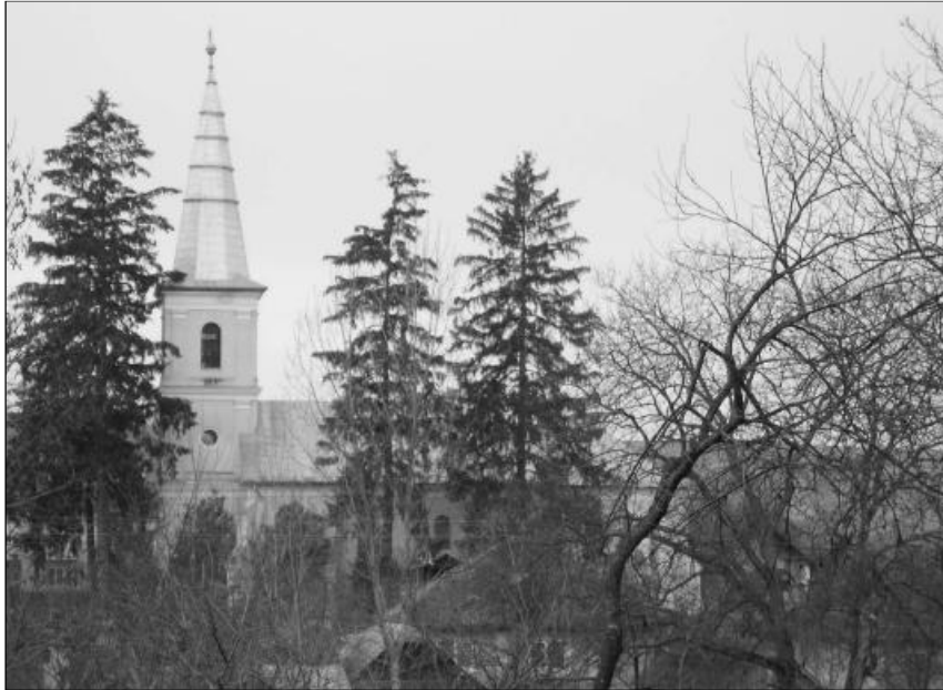
1899. április 12-én helyezték el az alapkövet, 8 hónap után már sor is kerülhetett a kész templom felszentelésére. Képünkön a 110 éves völcsöki templom fenyőfák „takarásában”

Isten iránti hálával emlékezhetünk meg arról, hogy a völcsöki református gyülekezet már 110 esztendeje hallgathatja az örök élet beszédét ebben a templomban.