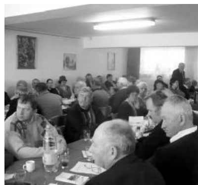
Hatvanhároman vettek részt a váradi-velencei egyházközséghez tartozó Agnelli Dei Református Szociális Központban tartott közgyűlésen

2009-es V. Partiumi Presbiter Konferenciát az Aradi Egyházmegye vállalta