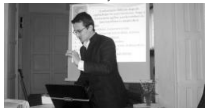
Gördülékeny és lendületes előadást hallhattak, láthattak a lelkészértekezlet résztvevői