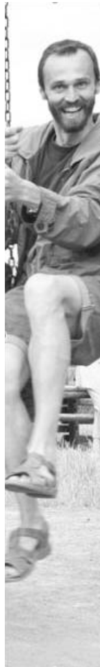
A nevetve, mosolyogva tanítás, a legkellemesebb és leghatékonyabb módszer

– Nagyon nem próbáltam „eladni” magam. Az egyik, kellemes elismerést teológus koromban kaptam, amikor firkákból és órák alatt a tanárokról titokban készített fotók-