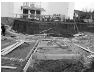
A gyülekezeti ház az épületegyüttes 60 százalékát teszi majd ki.

Akik adományokkal támogatni szeretnék a gyülekezeti ház építését, az alábbi folyószámlák egyikén tehetik meg: Parohia Reformata Oradea Rogerius. Cod fiscal: 4411238. Lej: Cod Iban: RO41 RNCB 0032046459800001; Euró: Cod Iban: RO14 RNCB 0032046459800002.