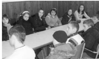
Jutalomkirándulásban részesülnek a bibliavasárnapi vetélkedő győztesei

BIBLIAVASÁRNAPI VETÉLKEDŐ ÉRMIHÁLYFALVÁN. Március 1-jén délután bibliavasárnapi összejövetelt tartottak gyerekek és ifjak részére a református gyülekezeti teremben.