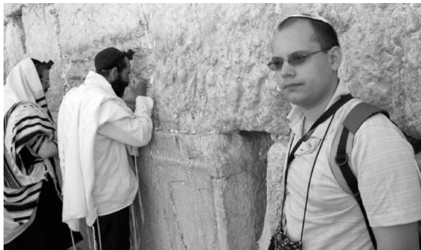
Szerzőnk a Siratófal előtt, fején a zsidó vallásban használatos sapkával, a kípával

„Magyarországon nagyon keveset tudnak arról, hogy Izraelben és a palesztin területeken mi történik. A legtöbb egyházi ember is csak a bibliai Izraellel kapcsolatos romantikus elképzeléseit vetíti rá a mai zsidó államra, pedig a kettőt nem lehet összehasonlítani.”