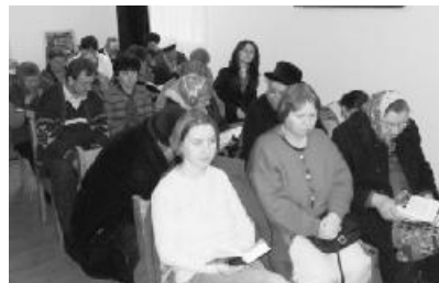
Sokan vettek részt a hegyközsatári világimnapon