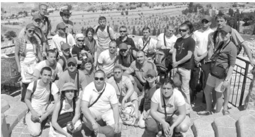
A teológiai hallgatók egy csoportja tavaly májusban tett látogatást a Szentföldön

Mélyen érintett az a rendíthetetlen, makacs vagy éppenséggel „vad” hit, amellyel sok kegyes zsidóval való találkozás alkalmával szembesültem. Egymásnak ellentmondó érzések kavargtak bennem, amikor némely izraelita „csomagolatlan” vallásosságával találtam szemben magam. Egy kicsit sértette is az én finomkodó, bátortalan „európai” hitemet. Itthon a nagy tolerancia-forradalom arra próbál nevelni, hogy akkor vagyok civilizált, ha kerülöm a konfrontálódást, ha mérsékelem magam és vigyázok kijelentéseimre, mert sohasem szabad elfelejteni, hogy a hitem, a vallásom az én legbensőbb ügyem, amelyet igyekezni kell ennek megfelelően elzártan kezelni, mielőtt bárkit is megbántanék megnyilvánulásaimmal. De vajon tényleg így van ez? Tényleg keresztyén magatartás „konzervdoboz-hittel” élni? Abban kaptam megerősítést zsidó testvéreimtől, hogy a „konzervdobozt” fel