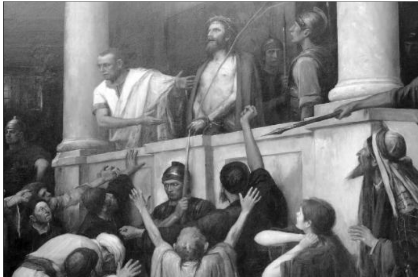
„Mit akartok tehát, hogy cselekedjem ezzel, akit a zsidók királyának mondotok?” Mk 15,12 Munkácsy Mihály: Ecce Homo! (Íme az ember!) 1896. (részlet)

Az életben csak egy biztos dolog van – szokták mondani – és ez a halál! A bölcső előreveti a koporsó árnyékát. Aki erre az életre született, alapjában véve a halálra született. Aki megérkezett erre a világra, egyszer bizonyosan búcsút is kell vennie és el kell távoznia erről a világról.