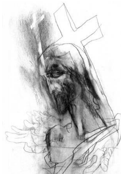
Deák Ferenc grafikája

megtörtént múltat, lezárja magában Jézus életét, tanítványi emlékeit, egybefogja, s vegegyen erő magán, hogy tovább menjen Jézusa életének tanulságaival.