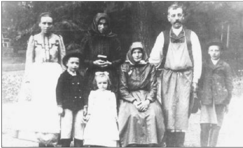
„A névadás szellemi odafordulást jelent, egy értékrend és egy világszemlélet felvállalását.” Református család a századelőn

Névadási szokásaink lassan, de jól érezhetően megváltoztak. Egyházi anyakönyveink a beszédes tanúságai annak, hogy magyar református gyermekeink egyre különösebb nevekkel élnek és néznek a jövő felé.