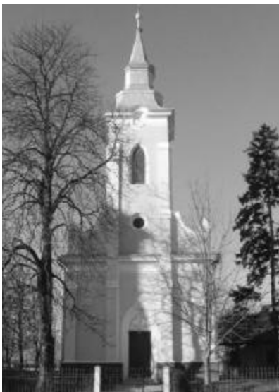
Az aranyosmeggyesi református templom

A templomot a Báthoriak templomából kitermelt kőből készült alapra és téglából építették, faszindellyel fedték. A templom