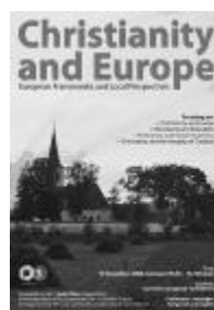
Erdélyi vártemplom a konferencia plakátján

Európai parlamenti képviselőként vegyes érzésekkel kellett tapasztalnom, hogy az ideológiai alapokon álló ateista materializmus – keleti – világából a szekularizálódott, nyugat-európai fogyasztói társadalom vulgáris materializmusának a világába csöppenem – mutat rá beszédében Tőkés László. Mint mondja: ebből a sajátosan ellentmondásos helyzetből kiindulva hirdette meg a Keresztyén Európát! elnevezésű programot, és ennek a missziói tervnek a részét