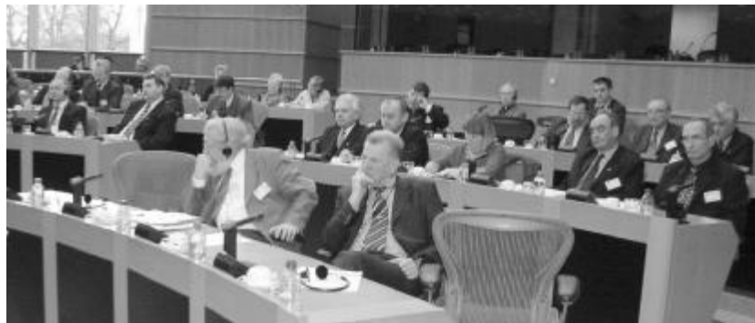
A háttérben az erdélyi, királyhágómelléki küldöttség tagjai a konferencia résztvevői között