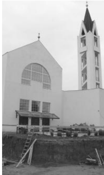
Mint már beszámoltunk róla, gyülekezeti házat épít a Nagyvárad-Rogériuszi Egyházközség. Képvén a 2008 nyarán megkezdett munkálatok helyszíne a templom előterében. Későbbi lapszámaink során visszatérünk az építkezés részleteire