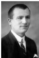
„Az Érmellék messiása”