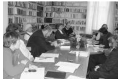
A konferencia a nagyváradi Dokumentációs Könyvtár nagytermében ért véget

Szó esett arról is, hogy az ukrán oktatáspolitikában egyre erőteljesebben érezeti hatását a nacionalizmus, melynek elsősorban a kisebbségek isszák a meg a levét. Kivételes helyzetben csak az ukrain oroszok vannak, akik számarányuk miatt autonómiát élveznek, s Moszkva nyílt támogatásának is köszönhetően más pozícióban vannak, mint a többi, csupán pár százezer főt számláló nemzetiségük.