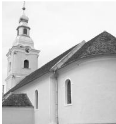
A mocsolyai református templom