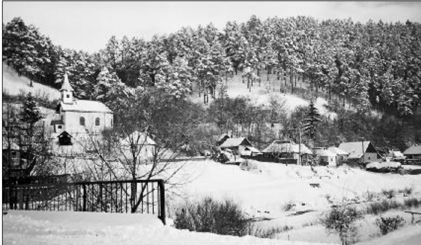
„Ballag már az esztendő/ vissza-visszanézve,/ nyomában az öccse jó/ vigan fűtyörésze.” (Kányádi Sándor: Ballag már). Tél az erdélyi Középjátn (archív felvétel)

Bár jól tudjuk, hogy Újév napja mint kezdet, kiindulási pont, mindössze ember csinálta illúzió az idő végtelenségében, mégis emberöltők óta ez a nap, amikor az ember számadást készíti a múltból, és terveket sző, fogalmakat tesz a jövőre nézve.