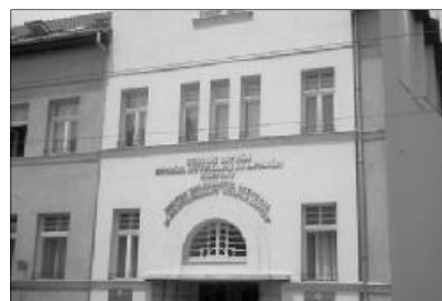
Az Egyházkerületi Székház napjainkban