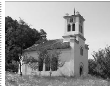
A hidalmási református templom

Péntek-szombat-vasárnapra hívjuk és várjuk a Presbiteri Szövetség teljes elnökségét, bizottsági tagokat és megyei elnököket. Előadások mellett, csoportos megbeszéléseken, szabadidős tevékenységeken lehet résztvenni. A táborban sportpálya, a településen strand, a környéken sok látványos áll az érdeklődők rendelkezésére. Kirándulást tervezünk a Sárkányok-kertjébe és Zsibóra.