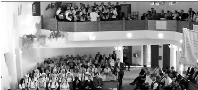
A Zilah-Ligeti református gyülekezet látta vendégül az egyházmegyei kórustalálkozó résztvevőit

A kórustalálkozó résztvevői Isten íránti hálából hangjukat, tehetségüket, szorgalmukat fordítják az Ő dicsőségére, embertársaik és saját maguk lelki épülésére. Minden kórus hosszú utat tesz meg, míg beérik munkája gyümölcse s a kórustalálkozók kiváló alkalmak közösségépítésre, kapcsolatok ápolására. A résztvevő kórusok egymást gyönyörködtethetik énekükkel, de az egyetlen Karmestert, aki leüti az alaphangot, Őt dicséri minden s mindenki, aki e találkozó résztvevője.