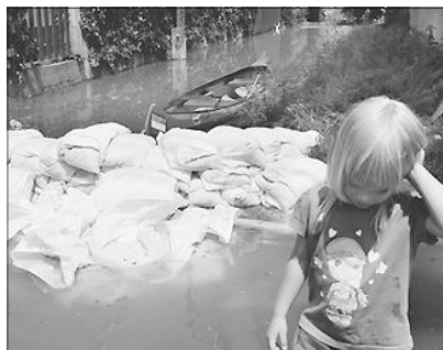
Az áradás Borsod megyében okozta a legtöbb kárt, mintegy 4500 embert kellett kitelepíteni.

KIRÁLYHÁGÓMELLÉKI SEGÍTSÉGNYÚJTÁS AZ ÁRVÍZKÁROSULTAKNAK. A magyarországi árvízkarosultak megsegítésére, pénzbeli adakozásra szólított fel június 8-i körlevelében a Királyhágómelléki Egyházkerület Igazgatótanácsa. „Tegnap ők segítettek nekünk, ma mi fogunk segíteni. Isten a közös teherhordozás ajándékával áldott meg bennünket, és ezzel enyhíti az áldozatok félelmét, és engedi meglátnunk a mindenek felett létező hatalmát.” – fogalmaz a felhívás. A királyhágómelléki gyülekezetek adományainak szétosztásáról a Magyar Református Szeretetszolgálat gondoskodik.