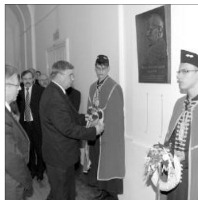
A felavatott Tisza-dombormű koszorúzása