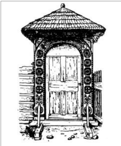
Kós Károly alkotása

iskolába, hát akkor honnét a tudása, honnét csodatévő ereje? Ő akar tanítani bennünket? Honnét is lennének hívők, ha gögösek? Hogyan hinnének Jézusnak, ha csupán saját tapasztalataiknak hisznek? Egy ilyen egyszerű családból jöhet próféta? Hiszen ismertük, mikor még inaskodott József mellett. Ezzel bezárják fülüket az evangélium előtt, bezárják szívüket Isten országa előtt, bezárják lelküket a kegyelem előtt. Korunk egyik legnagyobb csapása éppen az, hogy elveszti érzékét az igazság iránt. Az embereket nem az igazság, hanem a haszon érdekli. Egy társaságban a vallásra terelődött a beszélgetés. Valamennyien megegyeztek abban, hogy a hit már idejét múlta, hogy a tudomány megcáfolta a hitet és hogy nincs másvilág. Erre megszólalt az a valaki, aki eddig hallgatott. Sok minden elhangzott – mondotta – de senki sem bizonyított. Senki sem gondolkodott el, hanem egyszerűen továbbadta a propaganda divatos szövegeit. Hát igen, a hit kiment a divatból, de sajnos a becsület is. Jól van ez így? Mindenki érzi, hogy nem. És hogy a hit kiment a divatból, vele együtt a felelősség is. Jól van ez így? És hogy a tudomány megcáfolta a hitet, hát akkor honnét van, hogy olyan sok tudós mégis hisz? Hogy nincs másvilág? Nos, az a