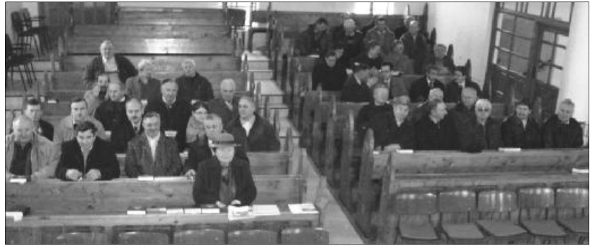
A Szamosnegyedi gyülekezetben tartották a tisztújító közgyűlést