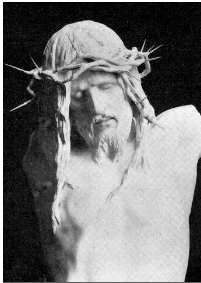
Fadrusz János: Krisztus a keresztfán

Hozzátok intézett szavaim lélek és élet (Jn 6,64) mondotta Jézus. És ezek a szavak ma csak akkor válnak életté, ha élő ajkokról és élő példákban fakadnak. A közösen el-