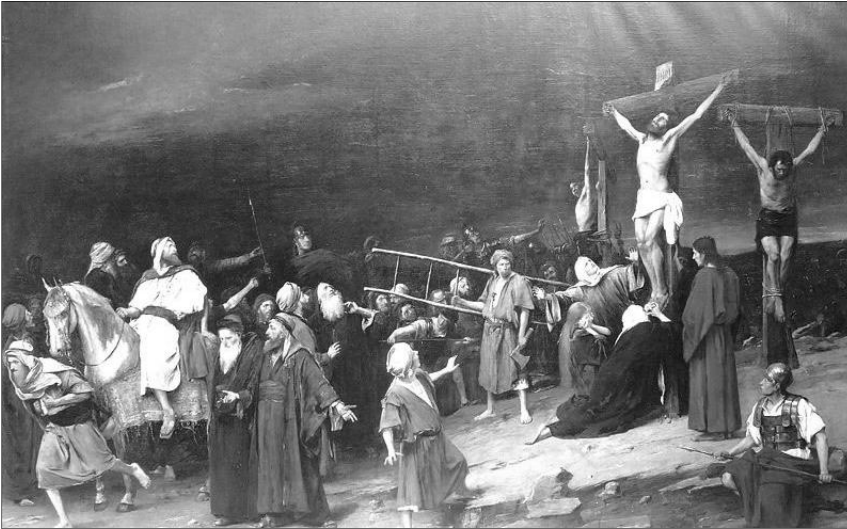
Munkácsy Mihály: Golgota című alkotása

A húsvét azt hirdeti, hogy Krisztus feltámadt és él. Élő, szerető, cselekvő Urunk van. Aki eszerint él az keresztyén. Ezzel ellentétben a nagyszombat arról szól, hogy Jézus a sírban van, mert meghalt. Halott az Úr. Van, de a sírban nem lát, nem hall, nem segít. Aki eszerint él az a nagyszombatista.