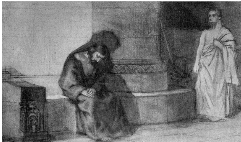
Nagy Zsigmond: Krisztus és Pilátus

Amint Pilátus meghallotta a Galileai szót, pompás ötlete támadt arra, hogyan szabadulhatna meg az ügytől. Ha Jézus galileai, akkor Heródes Antipász - aki ekkor éppen szintén Jeruzsálemben tartózkodott - eljárhat ügyében. Egy adott bűnyűben ugyanis az elkövetés helye szerinti hatóság kívül a vádlott lakóhelye szerinti hatóság is eljárhatott. Pilátus - kihasználva ezt az illetékességi szabályt - Jézus ügyét áttette Heródeshez.