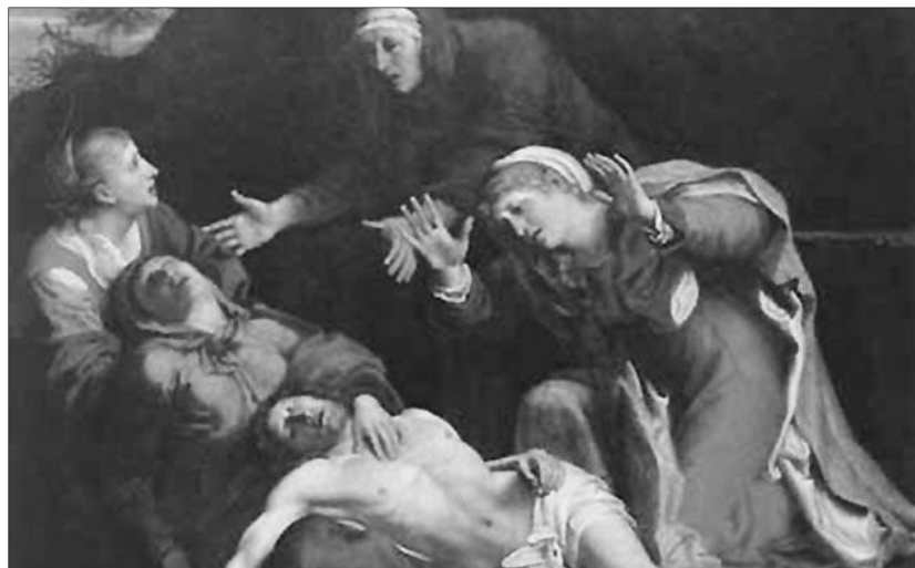
Caracci: Krisztus siratása