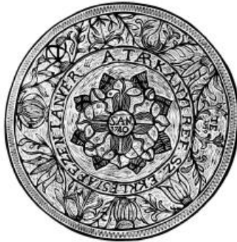
Radványi Károly: Köröstárkányi úrasztali tányér

Böjtölésünk lelki töltekezés, Krisztusra figyelés, hogy oszoljon lelki vakságunk, lelki sötétségünk, butaságunk. Krisztus szenvedésére, különösen kereszthalálára figyelünk, hogy vakokból látókká tegyen, lelkünk megtisztuljon s ürességében a Feltámadottal teljen meg, aki új, látó lélekkel ajándékozza meg földi életünket. Ne gondoljátok, hogy ti mindent láttok s mindent jól láttok, vizsgáljátok meg látásotokat, amikor Istenre néztek, amikor másokra tekintetek, amikor magatokat méritek. Csak Krisztuson keresztül lehet tisztán látni, s nem is érdemes rajta kívül nézni Istenét, embertársat, az ember önnön személyiségét.