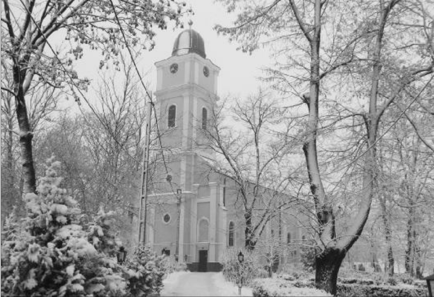
„Legyünk naponként megújuló új emberek, akik kérünk, keresünk és zörgetünk.” Érmihályfalva református temploma

Krisztus tanítványai tudják, hogy nem boldogulhatnak imádság nélkül. Azt is sejtik, hogy nem minden nevezhető fohásznak, ami e fogalom jegyében történik körülöttük, vagy éppen amit gyakorolnak ők is az ősi hagyományok nyomán.