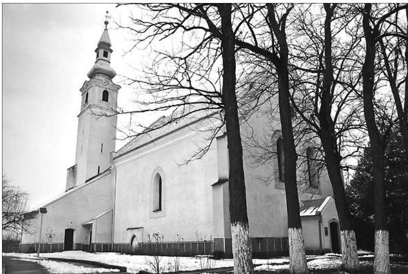
A szalárdi református templom

Az említett kutatások alapozták meg a szakszerű restaurálást, ami szerkezeti megerősítést, a fedélszék és az oromfalak rekonstrukcióját és külső-belső helyreállítást foglal