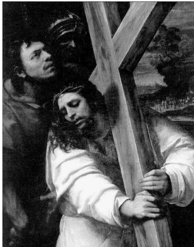
Sebastiano del Piombo: Krisztus a Kálváriára

Jézus mondja: Békességet hagyok rátok, az én békémet adom néktek, nem olyant, amilyent a világ adhat. Nem a gazdagok békéjét, akik tele vannak nyugtalansággal, nem az erő békéjét, melyet a fegyverek biztosítanak, nem a hatalom békéjét, mely a terrorra támaszkodik vagy a zsarolásra vagy a megfélemlítésre vagy az uszításra vagy a lejáratásra. Az a békesség, mely a föltámadt