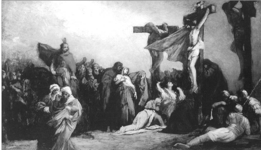
Székely Bertalan: Golgota

Nagypéntek és húsvét történései mindnyájunkat eligazítanak a halál és élet kérdésében. Sok tévhit, megannyi félelem és reménytelenség szerte foszlik, ha komolyan vesszük Urunk szavait: „Bizony, bizony mondom néktek, hogy aki az én beszédeimet hallja, és hisz annak, aki engem elbocsátott, örök élete van, és nem megy a kárhozatra, hanem átlament a halálból az életre.” (Jn 5,24)