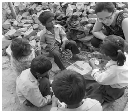
„Hol fogtok aludni ma éjjel?”

Keresztyénékkel találkozáva megkérdeztem, hogy a gyülekezeti házzal mi történt. „Lerombolták, az Isten házá!” Alig tudtam