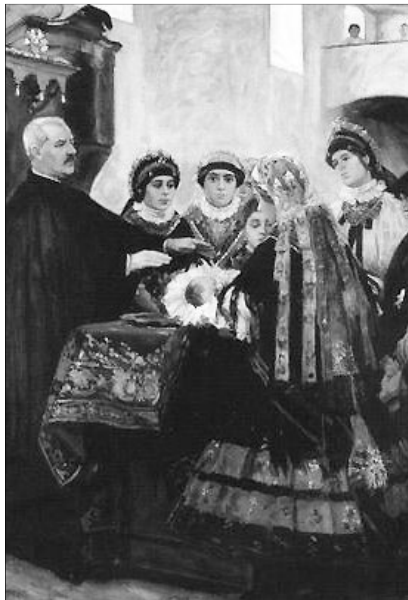
Csók István: Öcsényi keresztelő (1902)

Milyen nehéz keresztyénné lenni ebben a világban, amely a pénz bűvöletében él! Hiszen „minden baj gyökere a pénz szerelme” (1Tim 6,10). Az Egyház számára is mindig adva volt a veszély, a mában kell élnie, de nem a ma szelleme szerint. A feudális világban feudális, a polgári világban polgári volt a keresztyénség, ma, a konzum társadalomban, félő, hogy fogyasztói egyházzá válik az Egyház. Jézus tanította: „ahol a kincs, ott a szív” (Mt 6,21).