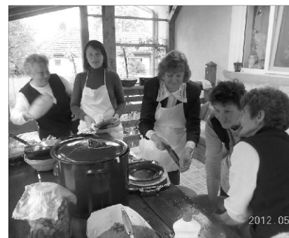
A nőszövetség ebéddel kedveskedett

A találkozó istentisztelettel kezdődött, melynek keretében szavallatokkal, énekkel köszöntötte a gyülekezet az ünnepelteteket, majd a gyülekezet nőszövetsége jóvoltából közös ebéddel folytatódott a rendezvény. Az idősek között voltak olyanok, akik már több éve nem vettek részt a gyülekezeti alkalmainkon vagy azért, mert az évek során más településre költöztek, vagy mert betegségeik, különböző testi nyomorúságuk ezt