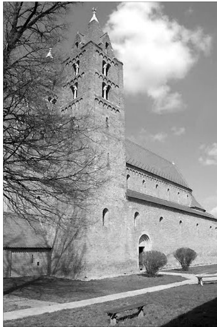
Ákos téglatemplomát a XII. század második felében kezdték építeni

Újabb építéstörténeti adalékként szolgált a templomtól északra 1999-2003-ban foly-