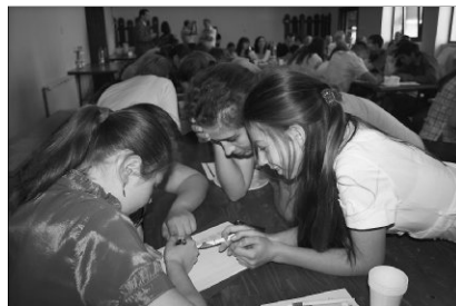
A helyes válasz nyomában