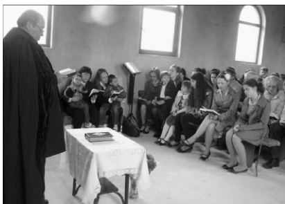
Először tartottak istentiszteletet az épülő templomban

✿ NÉMETSZENTPÉTER: ISTENTISZTELET AZ ÉPÜLŐ TEMPLOMBAN. „Eben-Háezer: Mindeddig megsegített minket az Úr!” Az 1Sám 7,12 volt az alapigéje a vasárnapi istentiszteletnek május 13-án, az épülő németszentpéteri templomban, Arad-Mosóc egyik szórványában. A majdnem 50 fős gyülekezet – gyermekek, fiatalok és idősebbek – hálás szívvel énekelték a 105. Zsoltárt, ki padon ülve, ki deszkákon, vagy tégladarabokon.