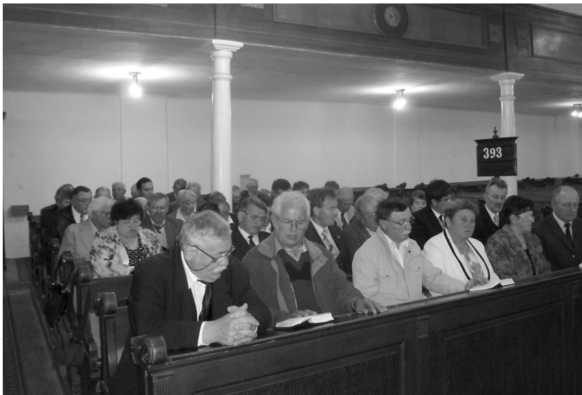
Tizenhat gyülekezet képviseltette magát Nagyszalontán

Második alkalommal szervezett konferenciát május 19-én a Bihari Egyházmegye Presbiteri Szövetsége, melyet ezúttal a nagyszalontai gyülekezet látott vendégül. A helyi református templomban tizenhat egyház-köztség képviseltette magát.