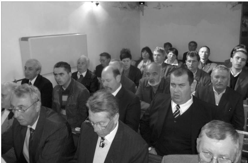
Tizenkét Sebes-Körös menti egyházközség presbiterei találkoztak Mezőtelkiben

A Mezőtelki Református Egyházközség adott otthont a tizenkét Sebes-Körös menti egyházközség presbiterei újabb találkozásának, április 22-én vasárnap délután. A találkozóknak évek óta hagyományuk van, az egyházközségek presbiterei, lelképásztoraik vezetésével minden évben két alkalommal: tavasszal és ősszel találkoznak.