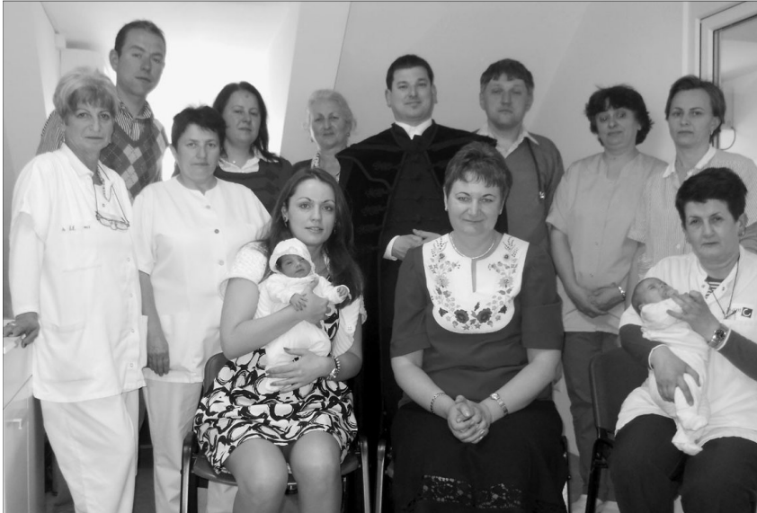
A kórházi alkalmak egyik felemelő pillanata, árva gyermek keresztelese az intézmény munkatársai körében

„És a hitből való imádság megtartja a beteget, és az Úr felsegíti őt. Valljátok meg bűneiteket egymásnak és imádkozzatok egymásért, hogy meggyógyuljatok.” Jak 5,15-16/b