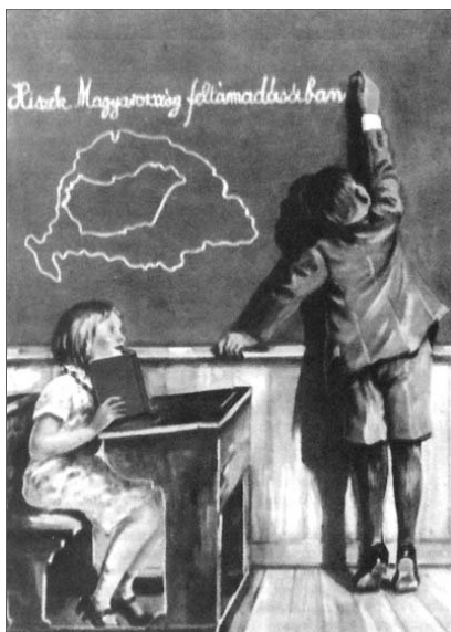
Hiszek Magyarország feltámadásában. Korabeli plakát