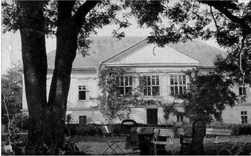
A Wass család lerombolt vasasszentgothárdi kastélya