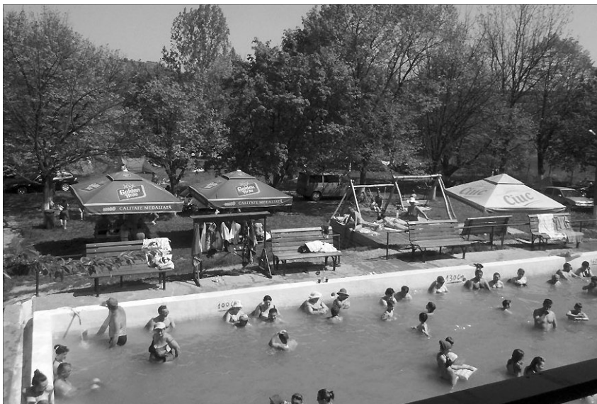
A fürdőt 1991 óta a helyi református egyházközség üzemelteti